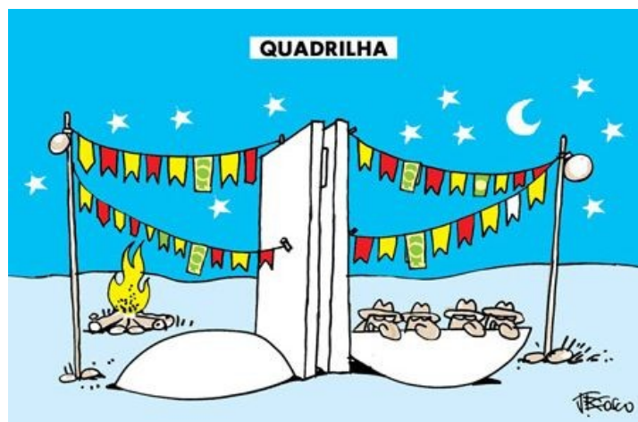
J. Bosco –Jornal 'O Liberal' – 21/06/2008

Observe atentamente as charges acima. Note que elas contêm um discurso tão recorrente na sociedade brasileira, que por vezes chega a ser considerado chavão – mas mesmo assim é um assunto que continua em voga.